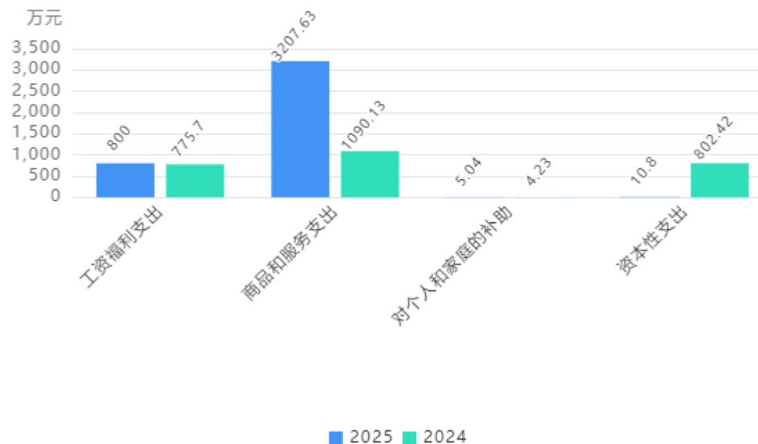
支出按部门预算支出经济分类对比图

2. 按照政府预算支出经济分类，本单位当年一般公共预算支出4,023.47万元，其中：