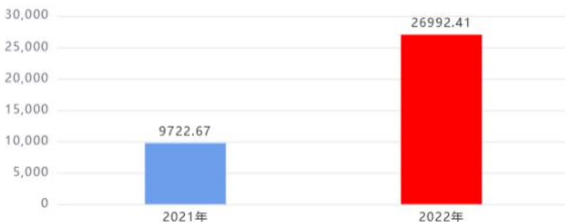
财政拨款收入、支出总计对比图 (单位: 万元)