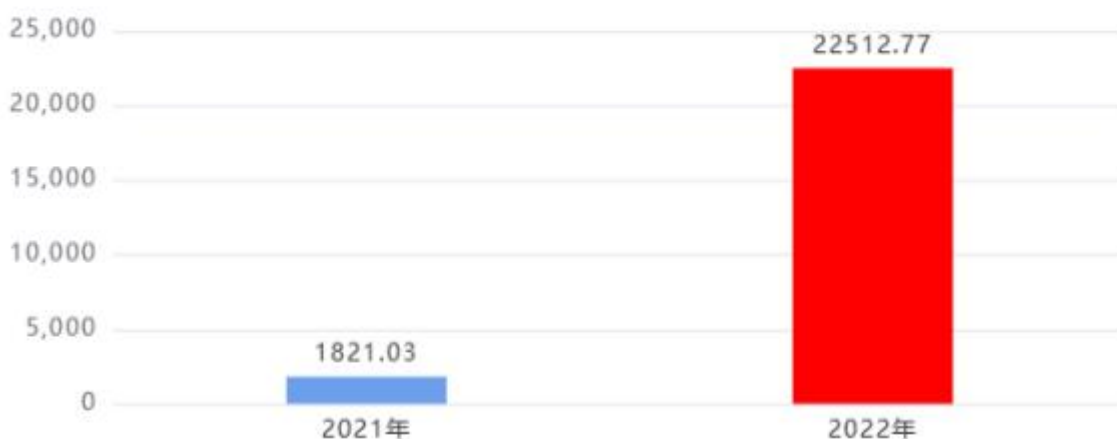
财政拨款支出对比图 (单位: 万元)

2022年度一般公共预算财政拨款支出年初预算260.54万元，支出决算22,512.77万元，完成年初预算的8640.71%，占本年支出合计的83.4%。与上年相比，财政拨款支出增加20,691.74万元，增长1136.27%，增长的主要原因是：项目增加，所需支出增加，预算增多。