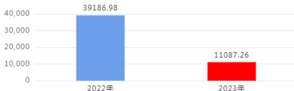
财政拨款收入、支出总计对比图（单位：万元）

2023年度财政拨款收入总计、支出总计均为11,087.26万元，与上年相比收入总计、支出总计均减少28,099.72万元，下降71.71%，下降的主要原因是：本年项目支出减少。