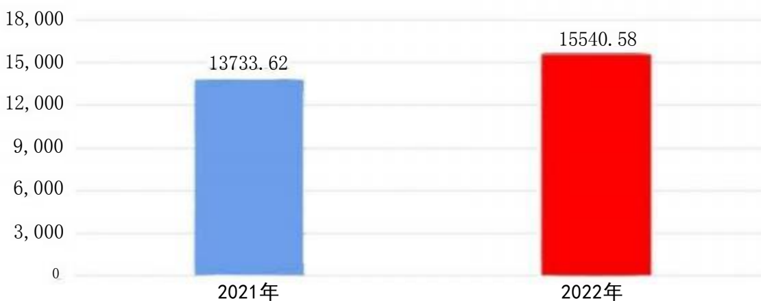
财政拨款收入、支出总计对比图(单位：万元)

公安分局整体划转我局，划转我局21人人员经费和公用经费收支增加；新招录人员及人员调增工资社保等经费收支增加；2022年召开党的二十大安保任务形成的资金收支增加，各类项目经费追加收支增加。