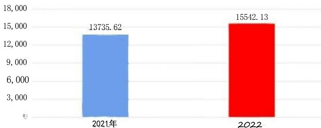
收入、支出决算总计对比图(单位：万元)

2022年度收入总计、支出总计均为15,542.13万元，与上年相比收入总计、支出总计均增加1,806.51万元，增长13.15%，增长的主要原因是：机构改革原周至县秦保局下属森林公安分局整体划转我局，划转我局21人人员经费和公用经费收支增加；新招录人员及人员调增工资社保等经费收支增加；2022年召开党的二十大安保任务形成的资金收支增加，各类项目经费追加收支增加。