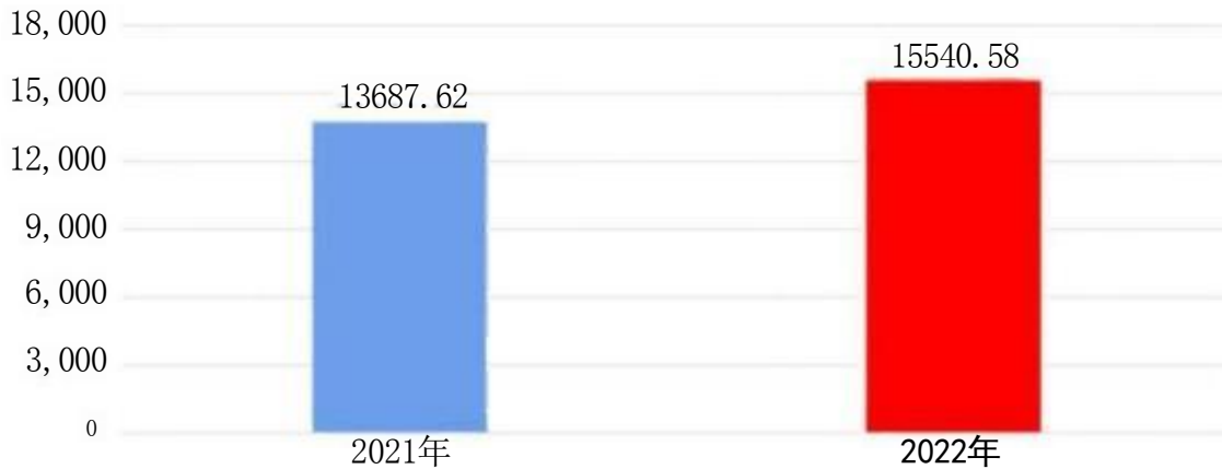
财政拨款支出对比图(单位：万元)