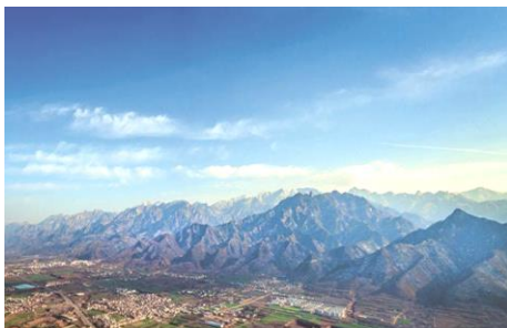
提升秦岭生态安全屏障质量