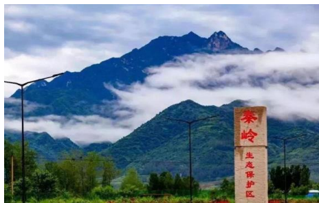
守住秦岭自然生态安全边界