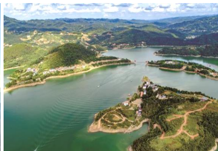
维护秦岭中央水塔功能